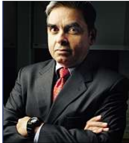
Mahbubani, 62, lehrt Politikwissenschaft an der National University of Singapore. Von 1971 bis 2004 vertrat er Singapur als Diplomat auf zahlreichen Auslandsposten.

Das Auftreten der Chinesen bei der UN-Klimakonferenz in Kopenhagen lässt nicht