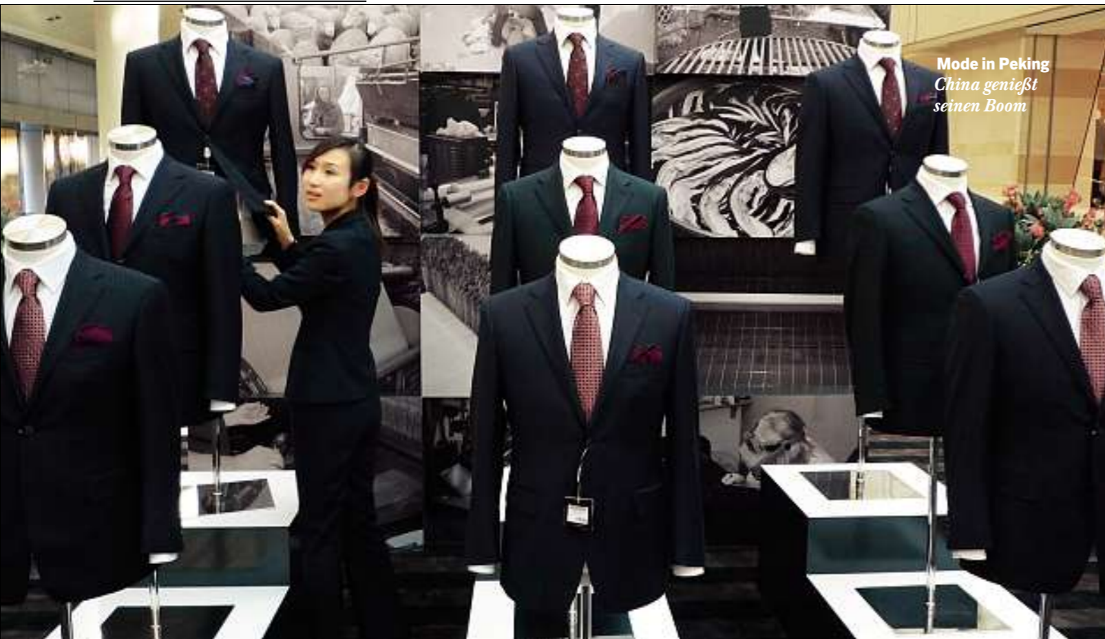
Mode in Peking China genießt seinen Boom