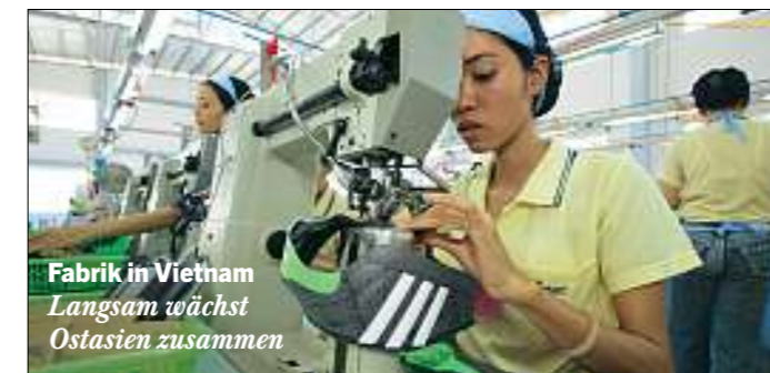
Fabrik in Vietnam Langsam wächst Ostasien zusammen

Erste Konturen des neuen Asiens sind heute schon erkennbar. Beim Handel etwa wächst die Region Stück für Stück zu einem einheitlichen Wirtschaftsblock zusammen, ein Trend, den die im Januar in Kraft getretene Freihandelszone zwischen China und den ASEAN-Staaten be-