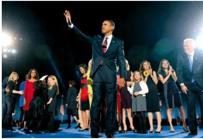
'Door Obama's verkiezing verdwijnt de helft van het anti-amerikanisme'

'Van de drie machtscentra in de wereld, Europa, Noord-Amerika en Azië, zijn de banden tussen Europa en Amerika en tussen Azië en Amerika goed. De missing link is die tussen Europa en Azië. Amerika probeert Azië wel blijvend voor zich in te nemen, bijvoorbeeld door Aziaten aan Amerikaanse