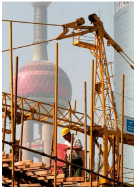
Westen heeft moeite met de opkomst van Azië

‘Een Belgische hulporganisatie ontdekte in een fabriek in Bangladesh kinderarbeid.’