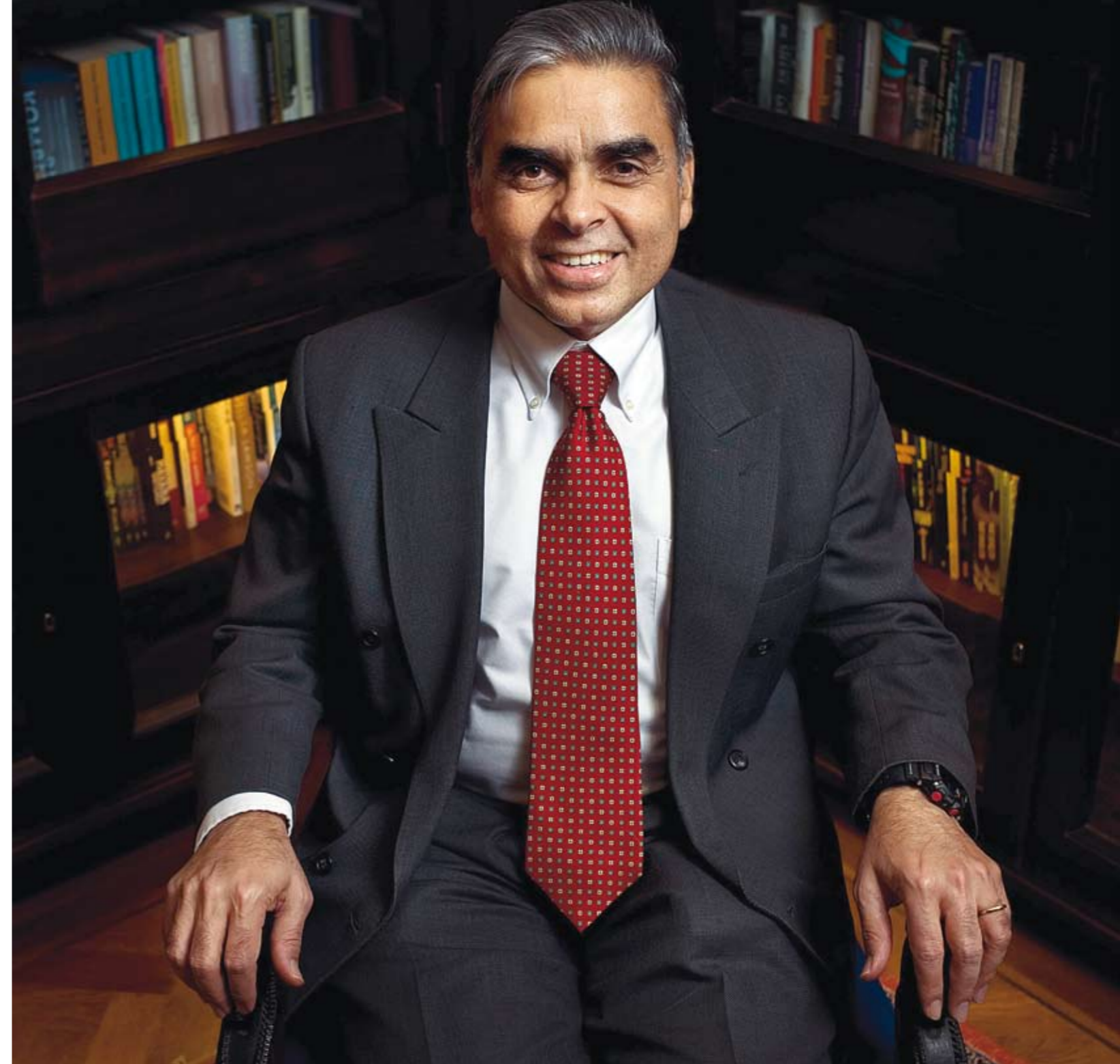
Kishore Mahbubani: ‘In China zie je nooit een demonstratie tegen de mondialisering: Chinezen hebben het nog nooit zo goed gehad’

Mahbubani beschrijft in zijn boek hoe moeilijk het Westen het heeft met de opkomst van Azië. ‘Het Westen heeft tweehonderd jaar lang de wereld gedomineerd. Nu komt door de groei van landen als China en India aan die dominantie een eind. Let wel, ik zeg niet dat het Westen ten onder gaat. Amerika en Europa zullen nog zeer lang de sterkste